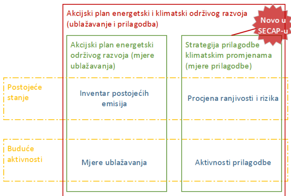
Slika 1: Prikaz sadržaja Akcijskog plana energetske i klimatske održive razvoja (tzv. SECAP-a)

Na slici je prikazana postojeća struktura i novosti koje donosi Akcijni plan energetske i klimatske održive razvoja grada u odnosu na dosadašnji Akcijni plan energetske održive razvoja grada. Postojeći Akcijni plan energetske održive razvoja sadržavao je samo mjere usmjerene k ublažavanju klimatskih promjena, odnosno, smanjenju emisija CO 2 , dok Akcijni plan energetske i klimatske održive razvoja, uz mjere ublažavanja, sadrži i prijedlog konkretnih mjera prilagodbe klimatskim promjenama.